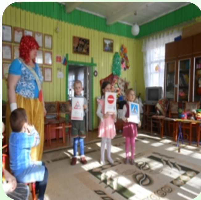
КВН «Знатоки правил дорожного движения»