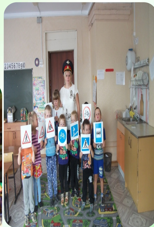
Открытое занятие «Путешествие в страну дорожных знаков»