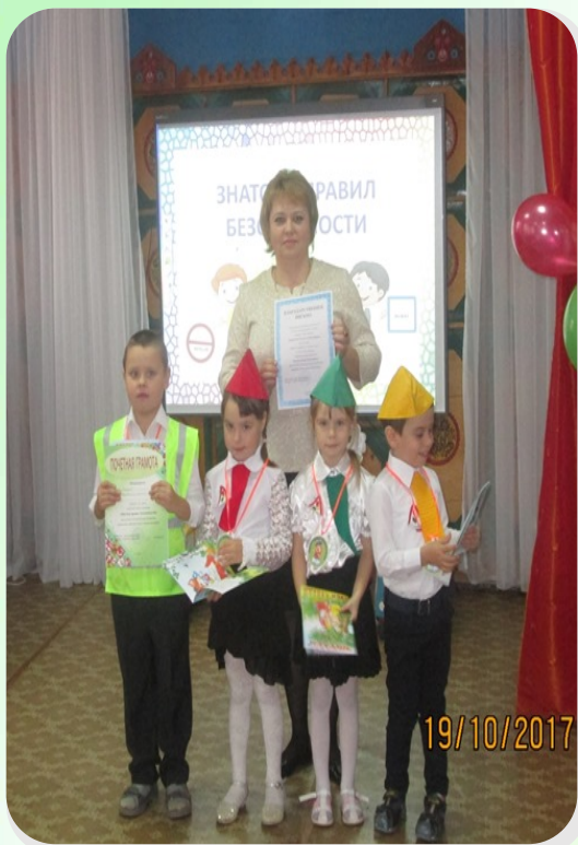
Команда « Огоньки» Победители районного конкурса «Знатоки правил безопасности» 2 место